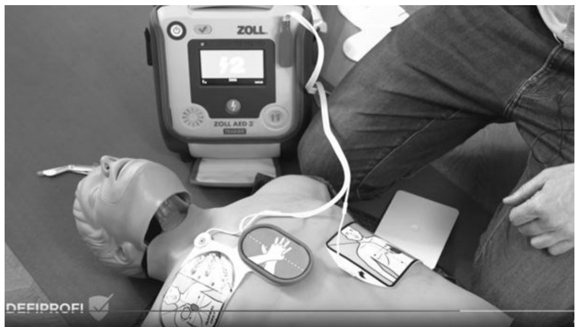
Der vollautomatischer Defibrillator Zoll AED 3 im Schulungseinsatz