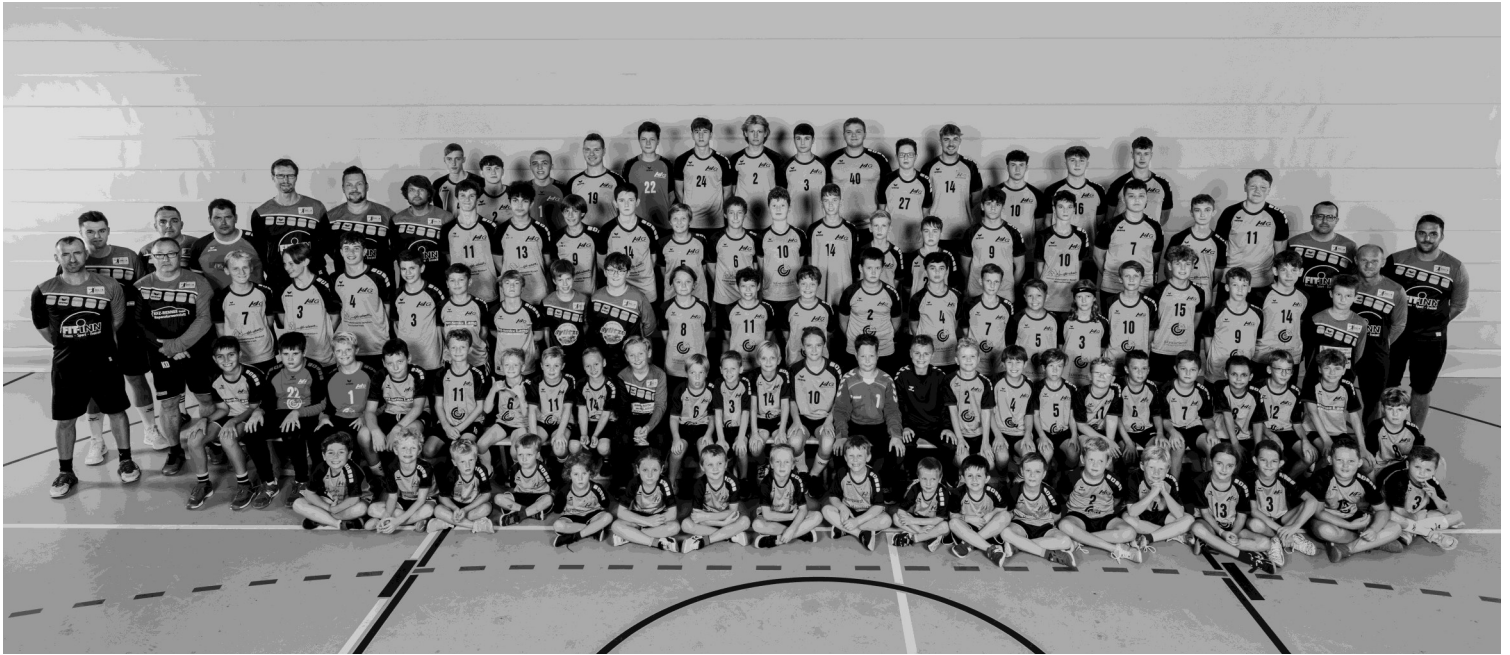
Die Mannschaften der Jugendspielgemeinschaft Weschnitztal mit Spielern, Trainern und Betreuer

Die JSG Weschnitztal hat eine sehr erfolgreiche Premiersaison in der erweiterten Konstellation Mitte März beendet. Die Handball Kooperation der Stammvereine SVG Nieder-Liebersbach, TV Reisen, SKG Ober-Mumbach, SKG Bonsweiher und TSV Birkenau spielte mit drei Mannschaften in der badischen Landesliga und vier weitere in den Bezirksligen. Zur im September begonnenen neuen Saison 2024/25, gelingt es der JSG, erstmals alle männlichen Jahrgangsstufen zu besetzen.