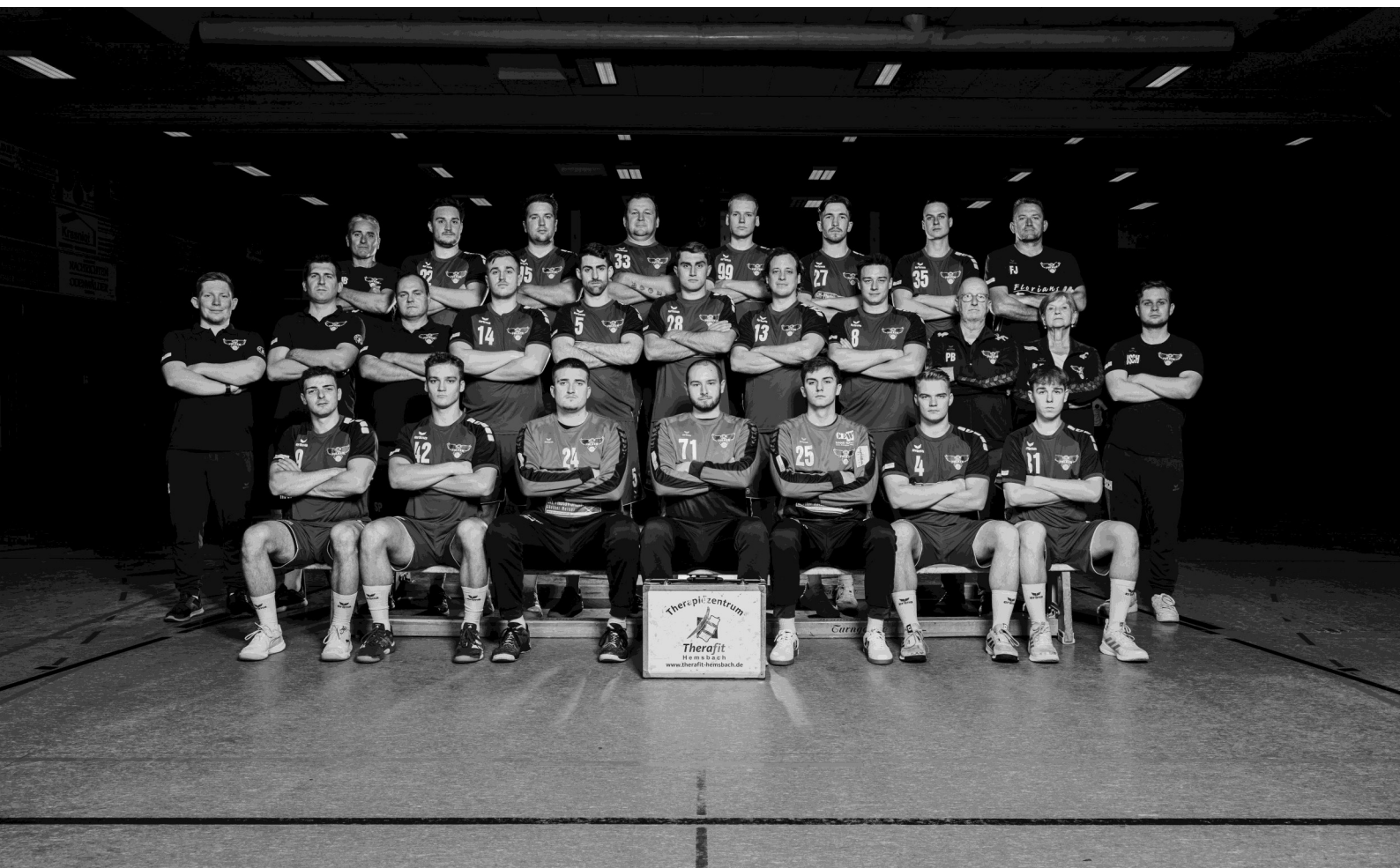
Die 1. Herrenmannschaft spielt in der Saison 2024-2025 in der Verbandsliga