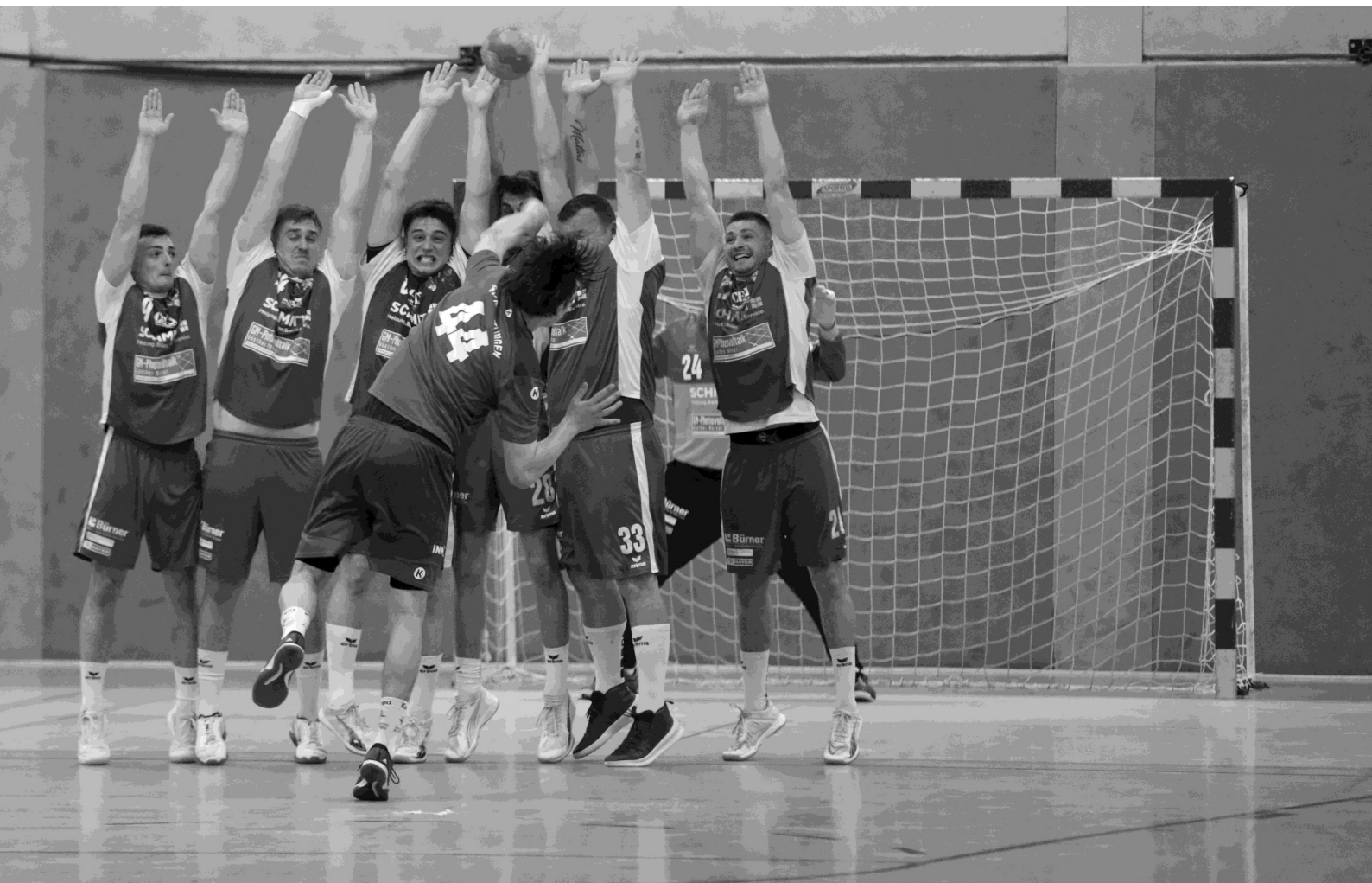
Die Abwehr des TSV im Heimspiel gegen den TSV Knittlingen