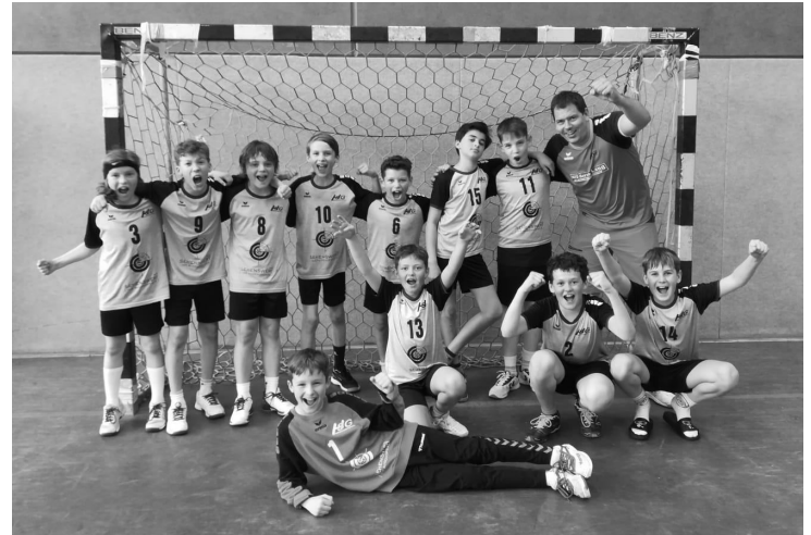
D1-Jugend der JSG Weschnitztal hat sich für die Landesliga qualifiziert