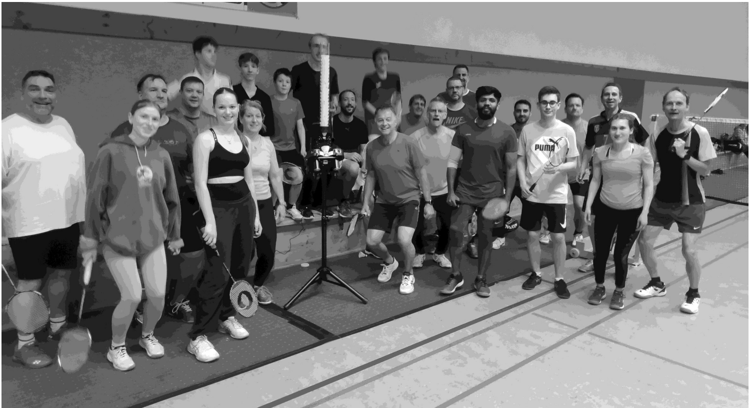
Badmintonspielerinnen und Badmintonspieler des TSV freuen sich über das neue Trainingsgerät

Die Badmintonabteilung des TSV Birkenau unter der Leitung von Olaf Klink erfreut sich immer größerer Beliebtheit. Wenn der TSV im Jahre 2005 nur 15 Badmintonspieler an den Badischen Badminton Verband gemeldet