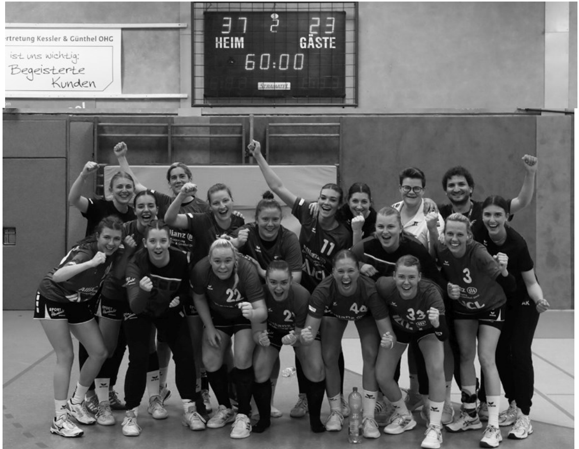
Damenmannschaft des TSV freut sich über den Heimsieg gegen die TSG Wiesloch